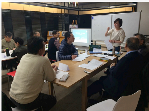
▲一生懸命発音を練習している様子

講座ではどなたでも気軽に参加できるように、中国語の勉強だけではなく、中国文化の理解を深めるため、面白いことわざなども紹介しました。